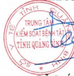
Đỗ Quốc Tiệp

Phiếu kết quả thử nghiệm này chỉ có giá trị trên mẫu được thử nghiệm do khách hàng mang tới. Các thông tin về tên khách hàng, tên mẫu, thông tin lấy mẫu được ghi theo yêu cầu của khách hàng.